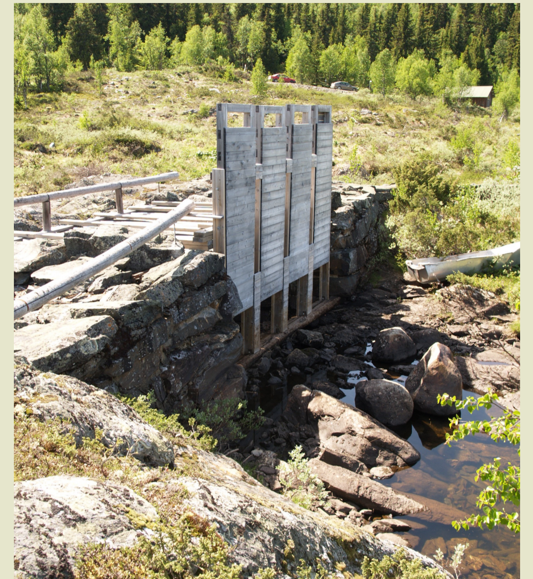
Etnesenn dammen 2007.

Rotvoll dammen vart bygd i 1847. Dammen hadde 8 luker.