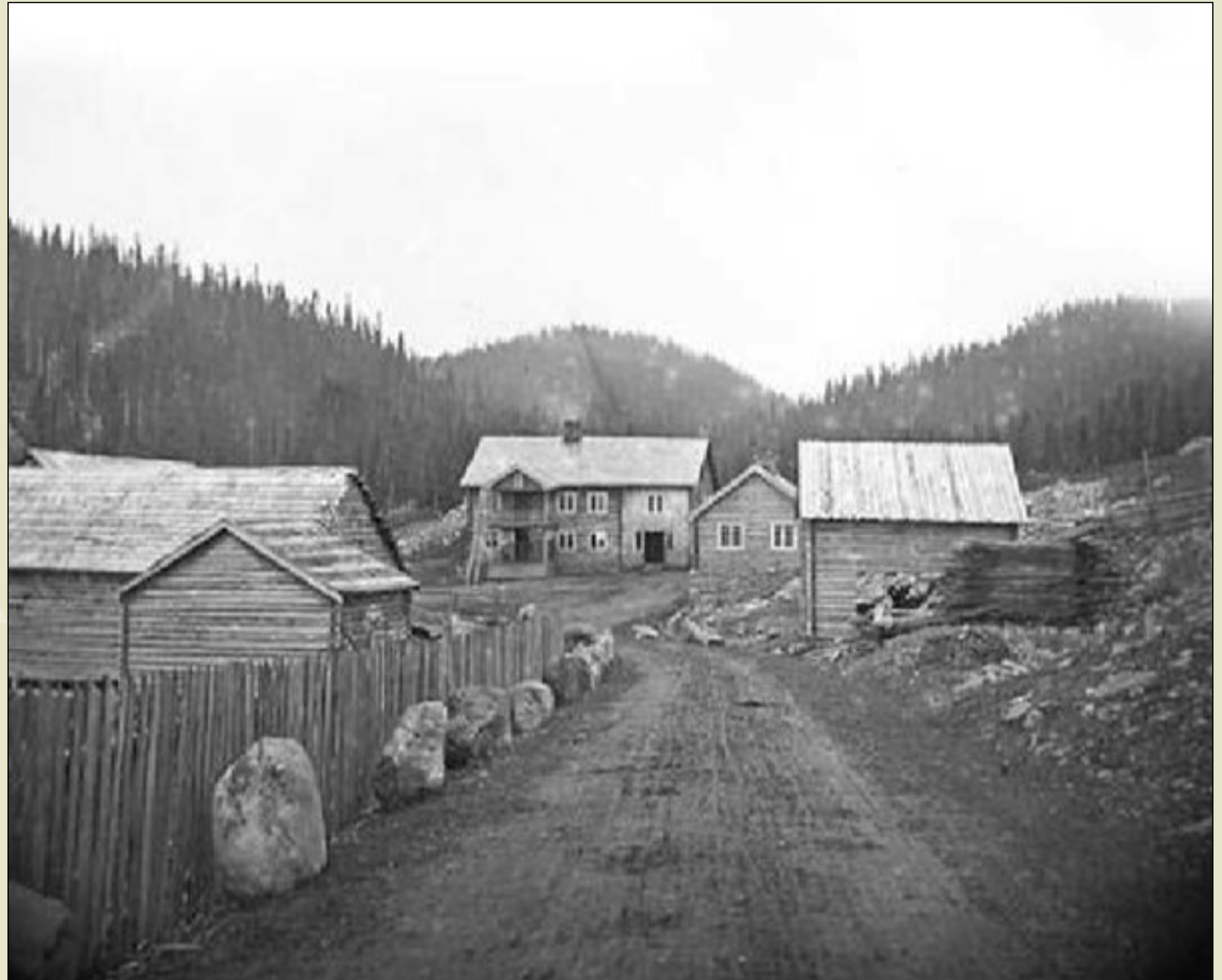
Gravadalen skystasjon var navnet på plassen der Tonsåsen sanatorium senere ble bygd. Skystasjonen var i drift fram til tidlig på 1870 tallet, og ble nedlagt da Stasjonsvee ble tatt i bruk.

Tekst og kart er utarbeidet av oberstløytnant og historiker Knut Werner-Hagen. Han baserer seg på 4. Brigades arkiv ved Forsvarsarkivet/Riksarkivet i Oslo og tysk arkivmateriale ved militærarkivene i Freiburg, Tyskland.