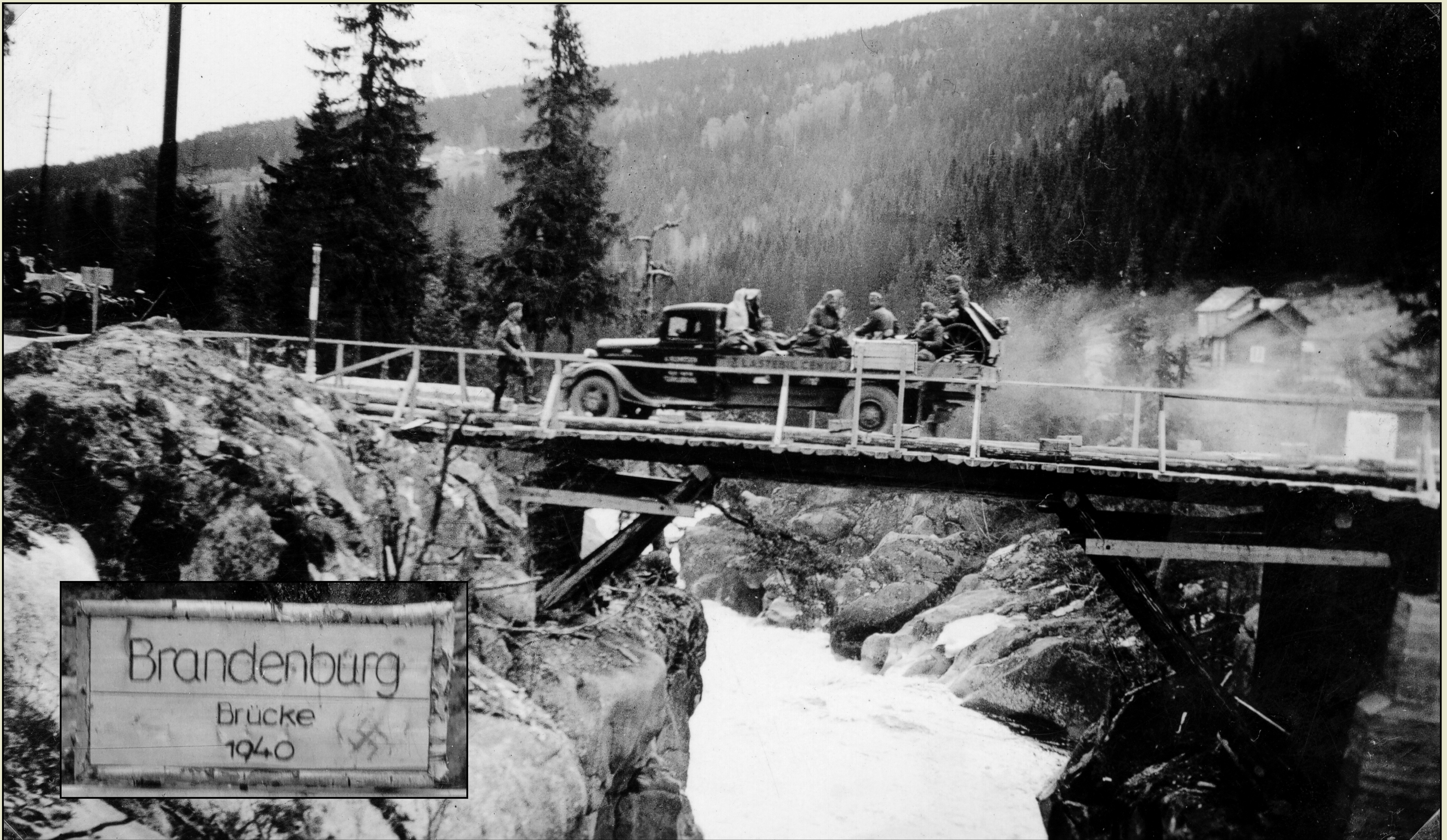
Høljarast bru slik den så ut etter å ha blitt bygd opp av tyske tropper i slutten av april 1940. Soldatene ga den nye brua navnet «Brandenburg Brücke», se skilt på brurekkverket og innfelt foto.