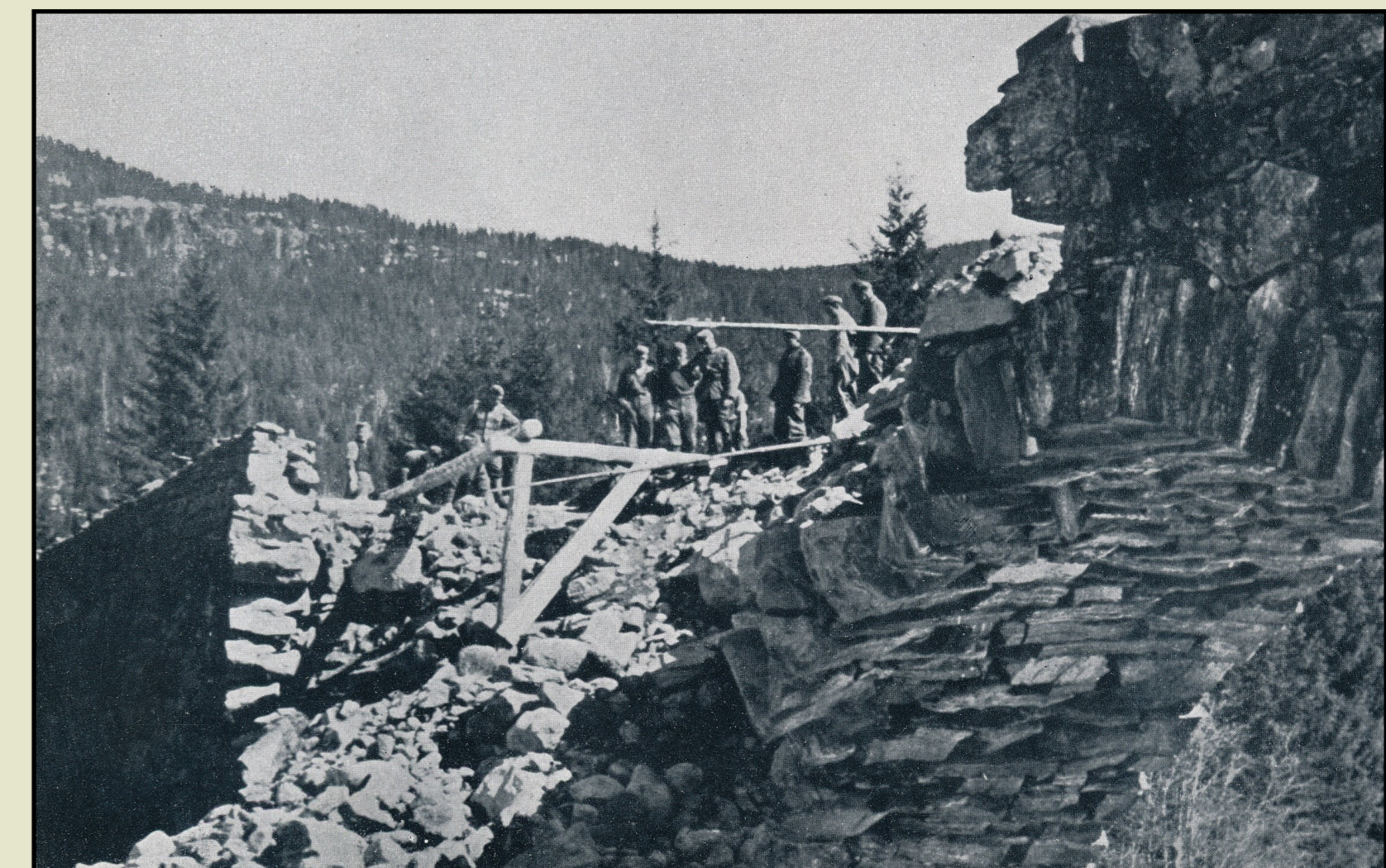
Tekst og kart er utarbeidet av oberstløytnant og historiker Knut Werner-Hagen. Han baserer seg på 4. Brigades arkiv ved Forsvarsarkivet/Riksarkivet i Oslo og tysk arkivmateriale ved militærarkivene i Freiburg, Tyskland.