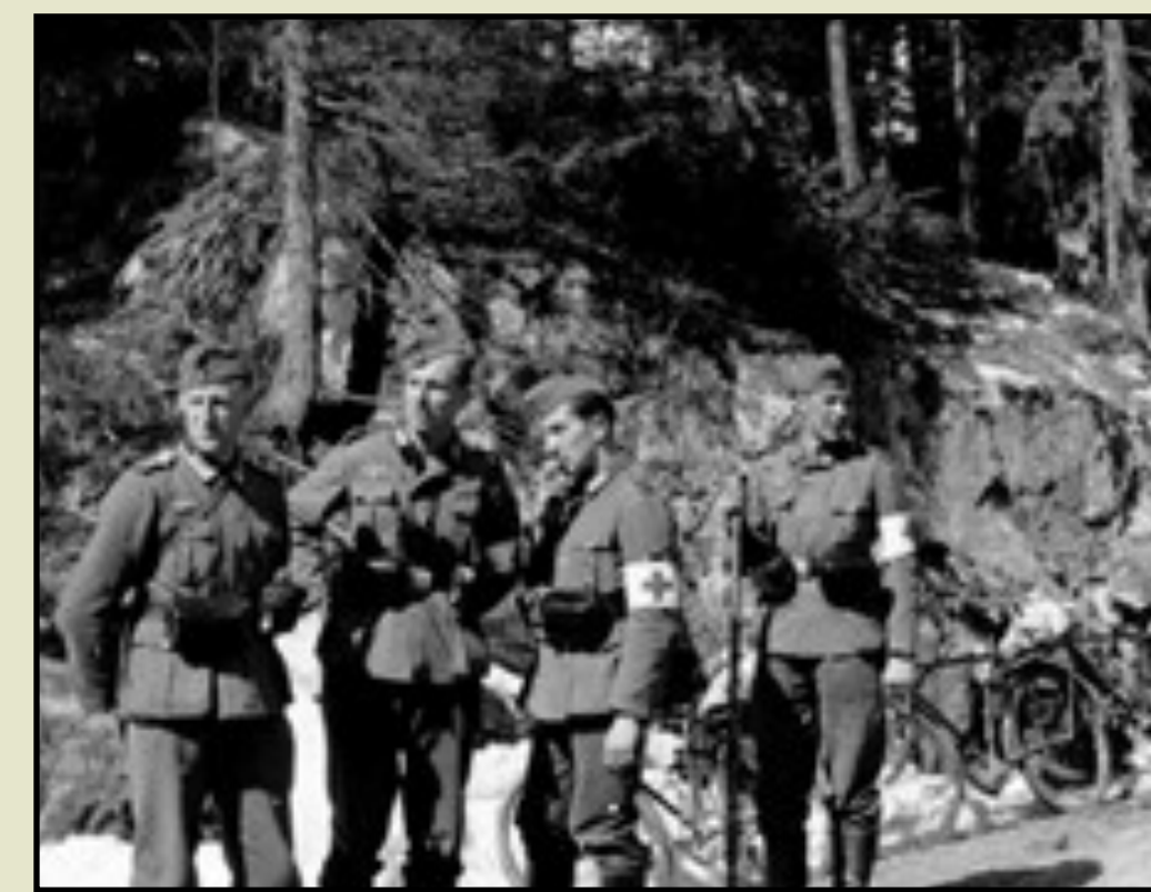
Tyske sanitetssoldater slapper av etter at kampene er over