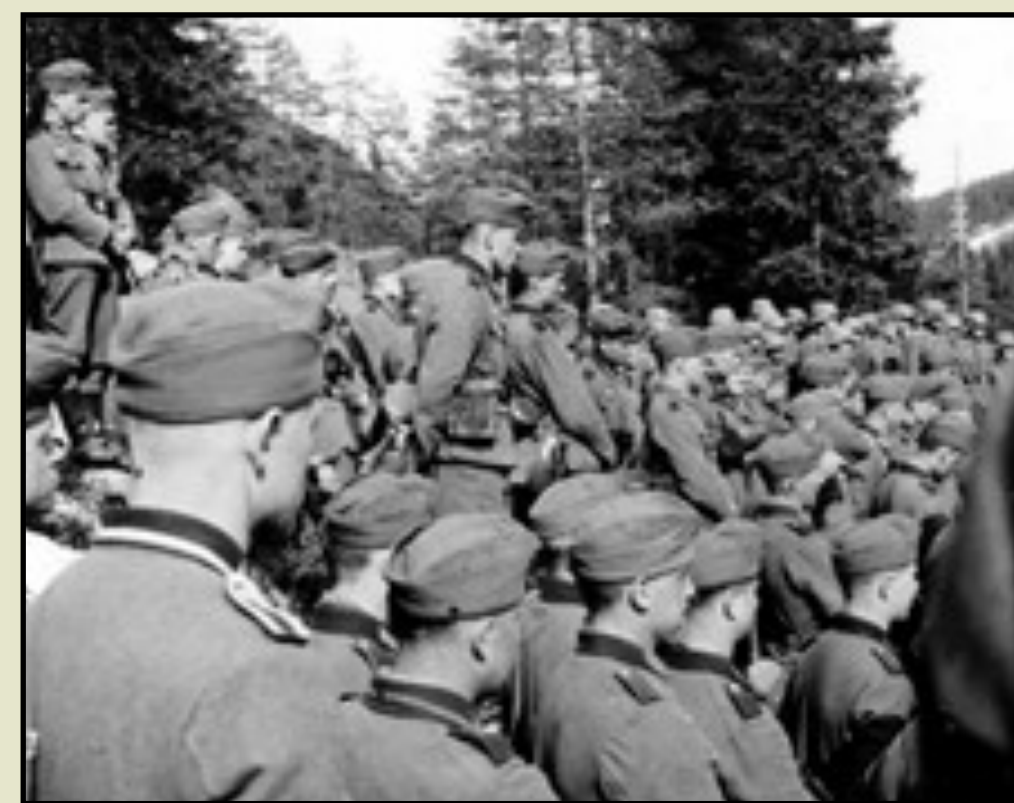
Tyske soldater samlet på nordsiden av brua etter kampene.