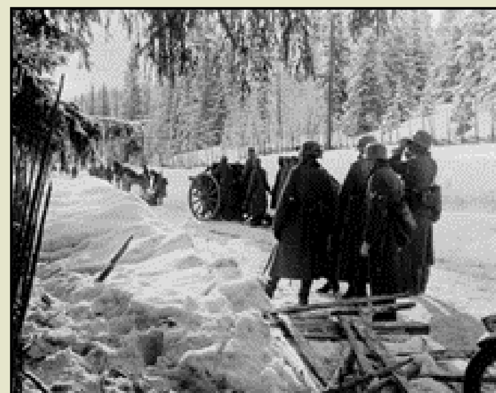
Tyske artillerister beskytter norske stillinger. Fotografiet er tatt noen dager før kampene ved Høljarast, men kunne like gjerne vært fra denne trefningen. Kanonene er norske.